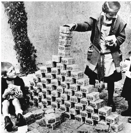
Niños alemanes usa pilas de papel dinero que había perdido gran parte de su valor, como bloques de construcción durante la inflación de 1923.

Con efecto en 1924, el Plan Dawes ayudó a desacelerar la inflación. Como la economía alemana comenzó a recuperarse, atrajo más préstamos e inversiones de los Estados Unidos. En 1929, las fábricas alemanas estaban produciendo tanto como lo habían hecho antes de la guerra.